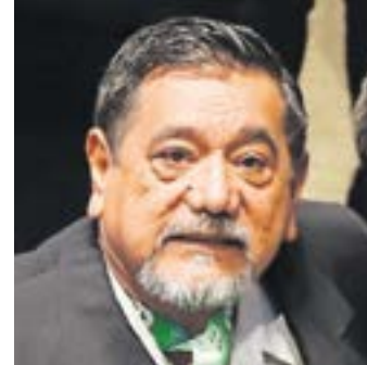
FÉLIX SALGADO MACEDONIO

Senador reelecto; buscó la candidatura al gobierno de Guerrero, la cual ocupó su hija.