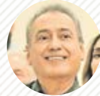
MANLIO FABIO BELTRONES PRI