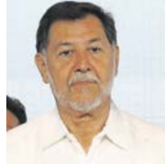
GERARDO FERNÁNDEZ NOROÑA

Actual diputado federal del PT, participó en el proceso interno a la Presidencia de la República.