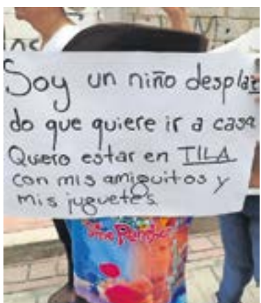
Pobladores exigen garantías de seguridad para poder regresar a sus hogares en Tila.

La violencia en el municipio de Tila inició el 5 de junio, cuando un grupo paramilitar, conocido como Los Autónomos asesinó a cinco personas, lesionó a tres más, quemó más de una veintena de viviendas y negocios y destruyó vehículos. ●