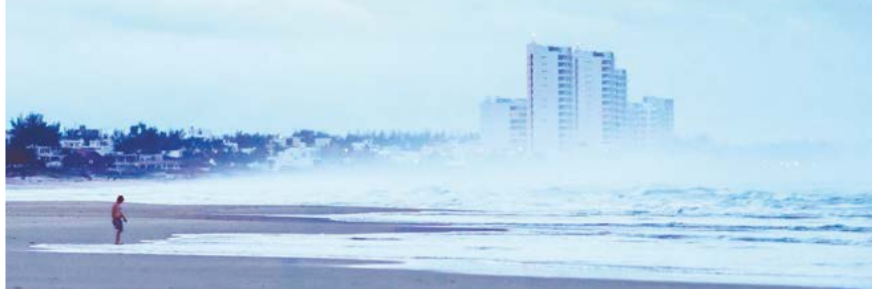
ROBERTO IVÁN ACILAR, EL UNIVERSAL

Tampico. — La tormenta tropical Alberto se enfilaba anoche hacia las costas de Tamaulipas y Veracruz. Se preveía que tocara tierra durante la madrugada en un punto entre Ciudad Madero y Tampico, Tamaulipas, y Pueblo Viejo y Tampico Alto, Veracruz. La tormenta provocará lluvias en al menos 20 estados, desde Coahuila hasta Quintana Roo. | ESTADOS | 8