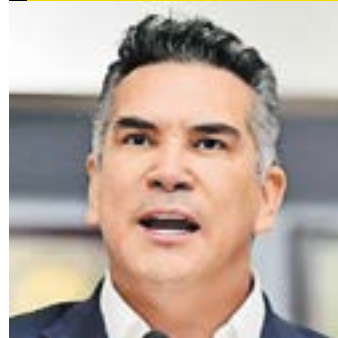
ALEJANDRO MORENO CÁRDENAS

Líder nacional del PRI, actualmente forma parte de la bancada tricolor en San Lázaro.