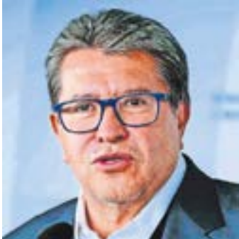
RICARDO MONREAL ÁVILA

Actual coordinador de los senadores de Morena; compitió en la interna por Morena.