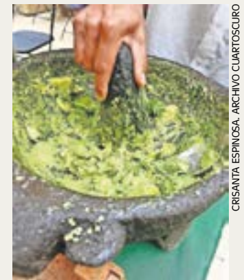
El gobierno mexicano busca una solución al problema.