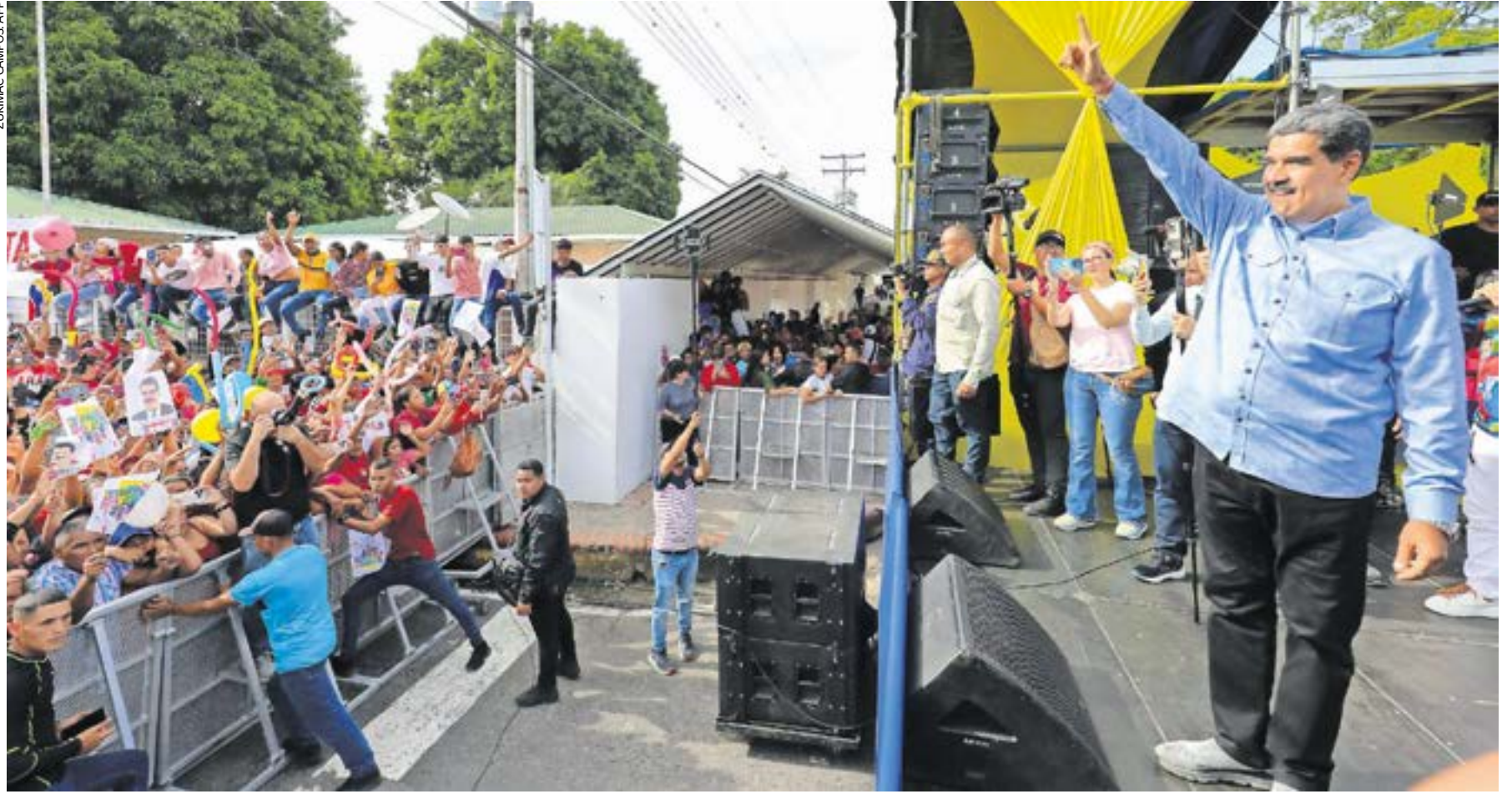
El presidente Nicolás Maduro en Barinas. En Venezuela, las ONG dedicadas a labores médicas, de auxilio a personas vulnerables, y de derechos humanos, han sido criminalizadas.

En Nicaragua, El Salvador, Venezuela y Perú han hostigado y clausurado a agrupaciones; analistas alertan que “crece el bloqueo a la acción cívica desde la sociedad”