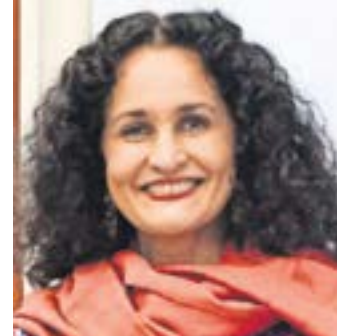
SUSANA HARP ITURRIBARRÍA

Artista y cantante oaxaqueña; vinculada a temas de carácter cultural e indígena.