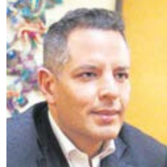
ALEJANDRO MURAT HINOJOSA

Exgobernador de Oaxaca que renunció al PRI; cercano al presidente López Obrador.