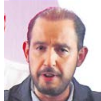
MARKO CORTÉS MENDOZA

Líder nacional del PAN; ha sido senador y coordinador de los diputados del blanquiazul.