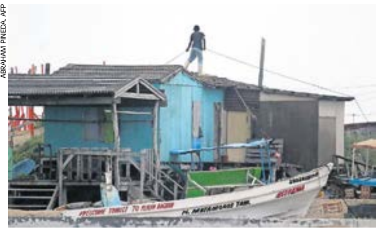
Un hombre aseguró su casa ante la llegada de la tormenta Alberto en Playa Bagdad, en Matamoros, Tamaulipas.

Además, el gobierno federal activó en Tamaulipas el Plan de Asistencia a la Sociedad en Casos de Emergencia (Plan GN-A) en su fase preventiva, para apoyar a la población que pudiera resultar afectada. Participan brigadas de apoyo, así