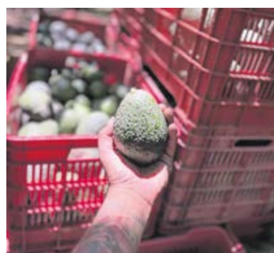
Estados Unidos frenó las importaciones de aguacate mexicano desde el pasado fin de semana.

"Percibo que están detenidos los cortes y que parte de esa producción se irá al mercado nacional y los precios tenderán a mejorar de algu-