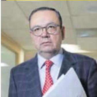
GERMÁN MARTÍNEZ CÁZARES

Actual integrante del Grupo Plural en el Senado; extitular del IMSS, y exlíder nacional del PAN.