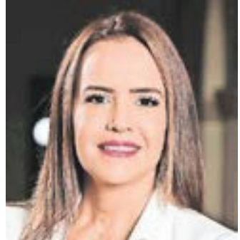
CLARA LUZ FLORES CARRALES

Extitular del Secretariado Ejecutivo del Sistema Nacional de Seguridad Pública.