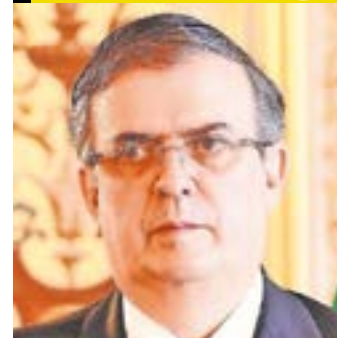
MARCELO EBRARD CASAUBON

Extitular de Relaciones Exteriores, compitió en el proceso interno de Morena.