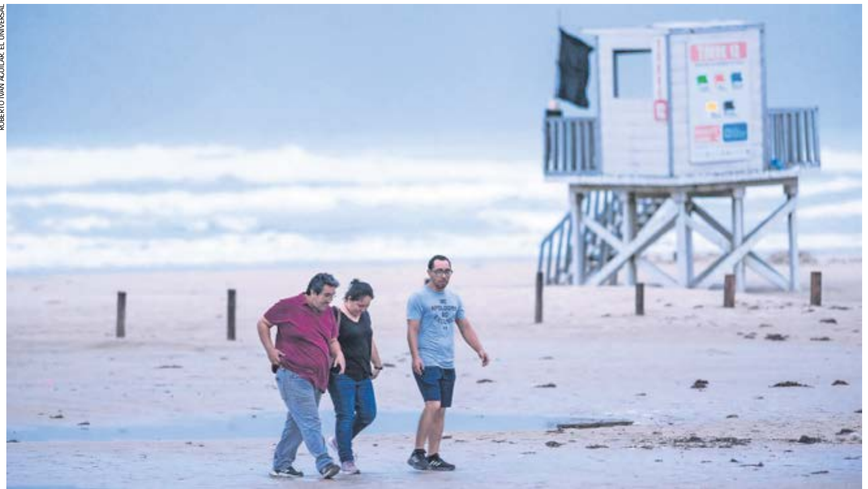
Algunas personas pasearon la tarde de ayer en Playa Miramar, en Ciudad Madero, Tamaulipas, a unas horas de la llegada de la tormenta tropical Alberto .