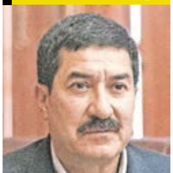
JAVIER CORRAL JURADO

Exintegrante del PAN y exgobernador de Chihuahua; ya ha sido diputado y senador.