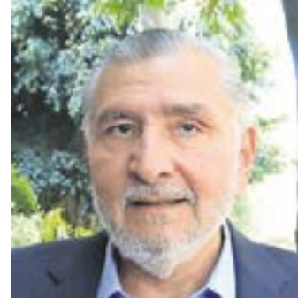
ADÁN AUGUSTO LÓPEZ HERNÁNDEZ

Exsecretario de Gobernación y exgobernador de Tabasco; fue aspirante a la Presidencia.