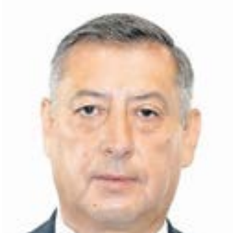
PEDRO ZENTENO SANTAELLA

Exdirector del ISSSTE y diputado federal en la 64 Legislatura.