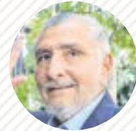
ADÁN AUGUSTO LÓPEZ Morena