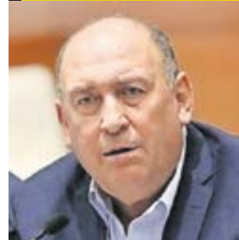
RUBÉN MOREIRA VALDEZ

Actual líder de los diputados federales del PRI; exgobernador de Coahuila.