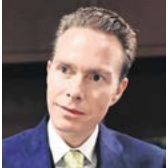
MANUEL VELASCO COELLO

Exgobernador de Chiapas y actual senador reelecto; aspiró a la nominación presidencial.