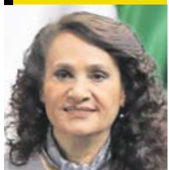
DOLORES PADIERNA LUNA

Exdiputada, exsenadora y exjefa delegacional de Cuauhtémoc.