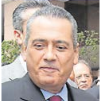
MANLIO FABIO BELTRONES RIVERA

Expresidente nacional del PRI y exgobernador de Sonora; ha sido diputado y senador.