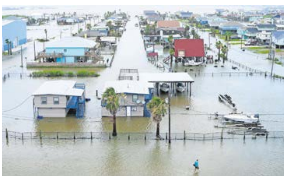
La tormenta Alberto dejó inundaciones en Surfside Beach, Texas.

Mientras, una ola de calor ha disparado las temperaturas en el noreste de Estados Unidos y persistirá durante lo que queda de semana afec-