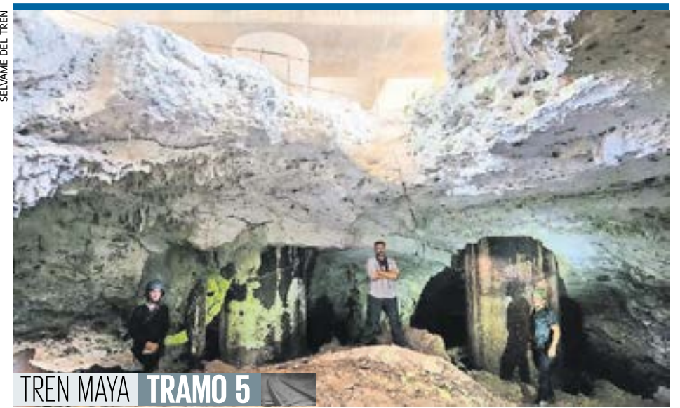
SÉLVAME DEL TREN

La Secretaría de Cultura informa que la nueva cineteca estará lista en agosto y la Bodega Nacional de Arte en septiembre. | 5 |