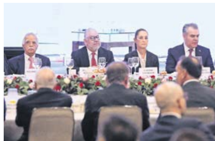
En la reunión con la virtual presidenta, los empresarios anunciaron inversiones por más de 42 mil millones de dólares.

“Hay muchas inversiones por encima de los 42 mil millones de dólares”, dijo, lo que incluye inversión extranjera directa y proyectos de capital nacional. ●