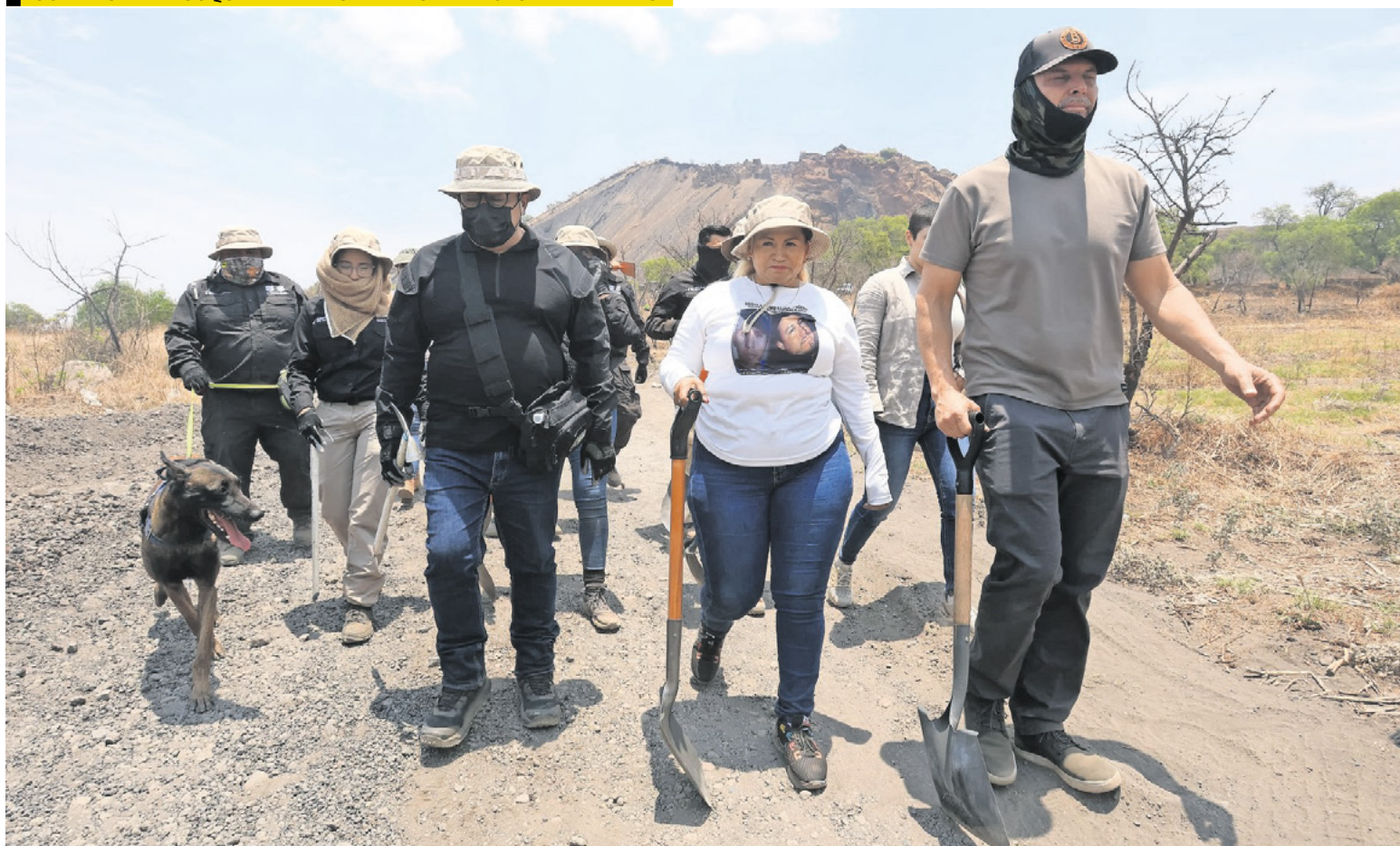
GABRIEL PANO, EL UNIVERSAL