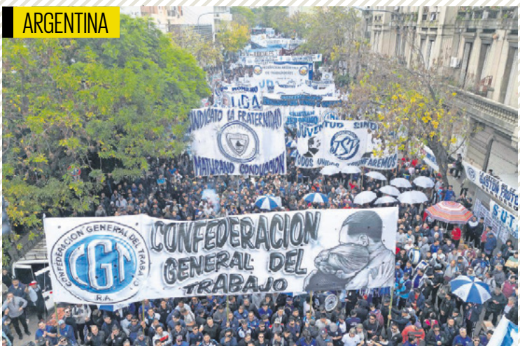
Integrantes de organizaciones laborales marcharon durante la manifestación por el Día del Trabajo, en Buenos Aires.