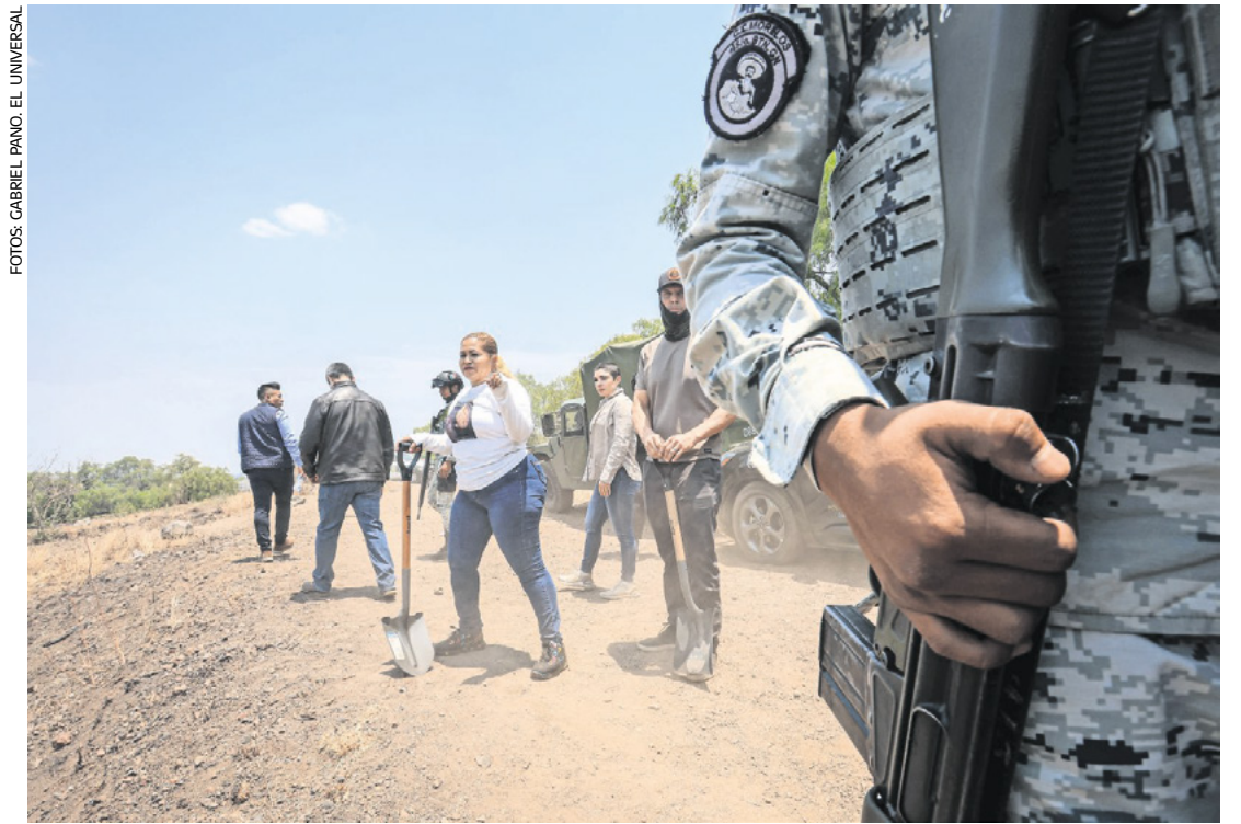
La tarde del martes madres buscadoras encontraron un presunto crematorio clandestino en los límites de las alcaldías Tláhuac e Iztapalapa, en las faldas del volcán Xaltepec.

El encargado de despacho de la fiscalía capitalina, Ulises Lara, junto al secretario de Seguridad Ciudadana, Pablo Vázquez, aseguró en tanto que no hay un crematorio ni fosa clandestina en el paraje ubicado en las inmediaciones de las alcaldías Iztapalapa