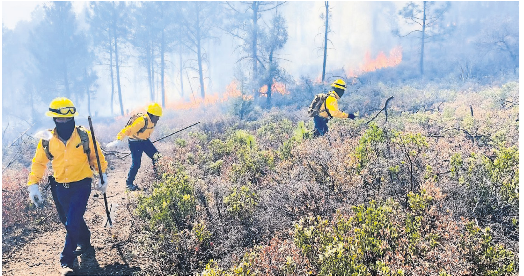
Los siniestros se han concentrado en municipios de la Sierra Tarahumara, como Temósachic, Guerrero, Guadalupe y Calvo, Guzapares y Guachochi entre otros.