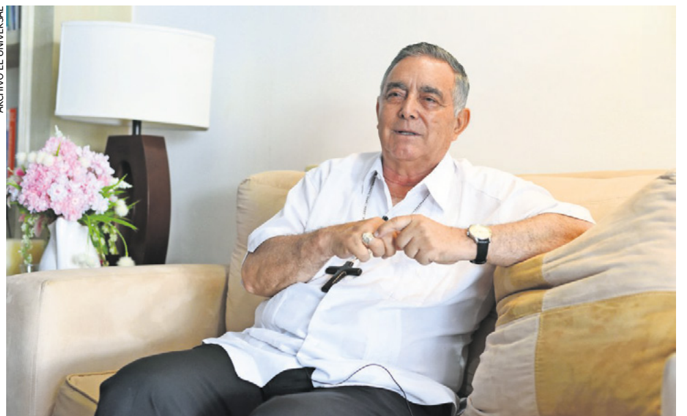
La fiscalía de Morelos informó el lunes que investiga un presunto secuestro exprés contra el obispo; el martes, el gobierno estatal cuestionó esa versión.

datos de alerta en cuello y tórax; manifestaba una adecuada dinámica respiratoria y no se auscultan estertores o sibilancias, tampoco complicaciones en pleuropulmonares.