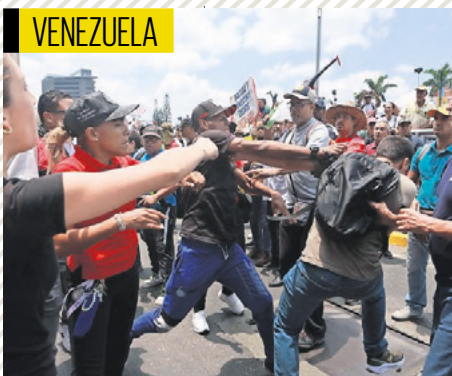
Un partidario del gobierno golpea a un opositor en una marcha en Caracas.

"Sólo Bolivia y Estados Unidos utilizan elecciones judiciales para seleccionar a juezas y jueces de tribunales con jurisdicción constitucional"