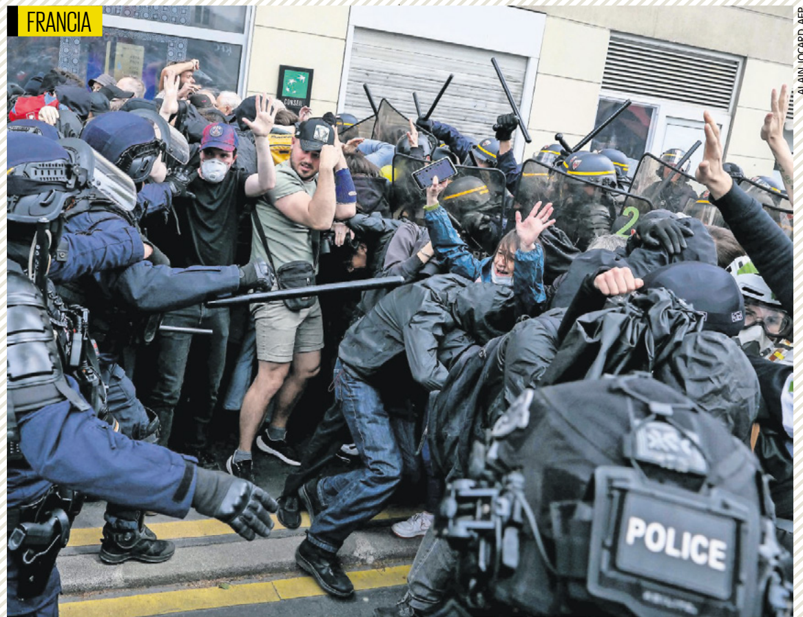
La manifestación sindical degeneró en disturbios en París; los asistentes lanzaron diversas reivindicaciones contra la reforma del seguro de paro o por la reclamación de aumentos salariales.