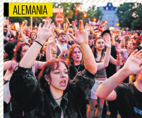
Asistentes a una manifestación por el 1 de mayo en Berlín.