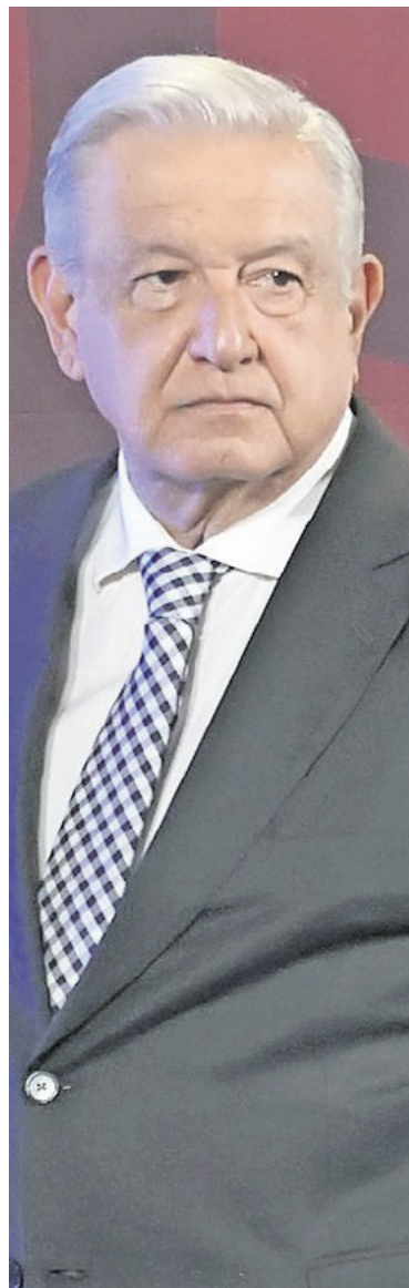
El presidente Andrés Manuel López Obrador el 24 de abril pasado.